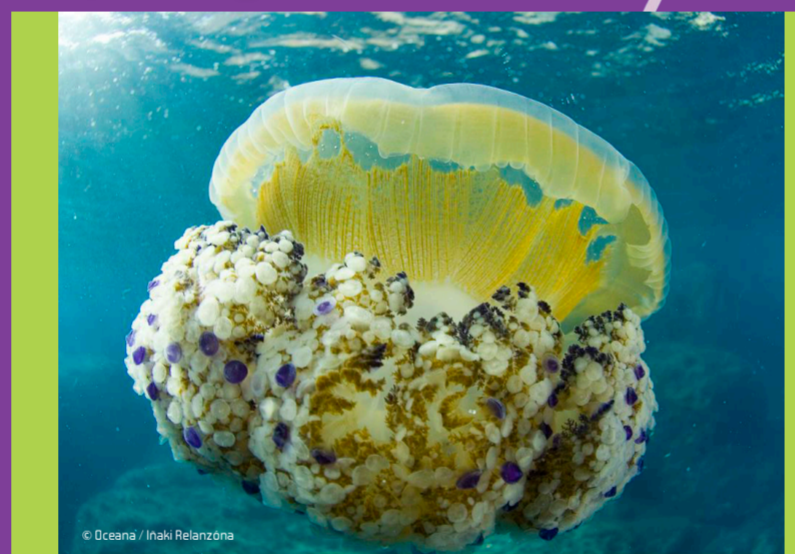
Medusa huevo frito Cotylorhiza tuberculata Peligrosidad: BAJA