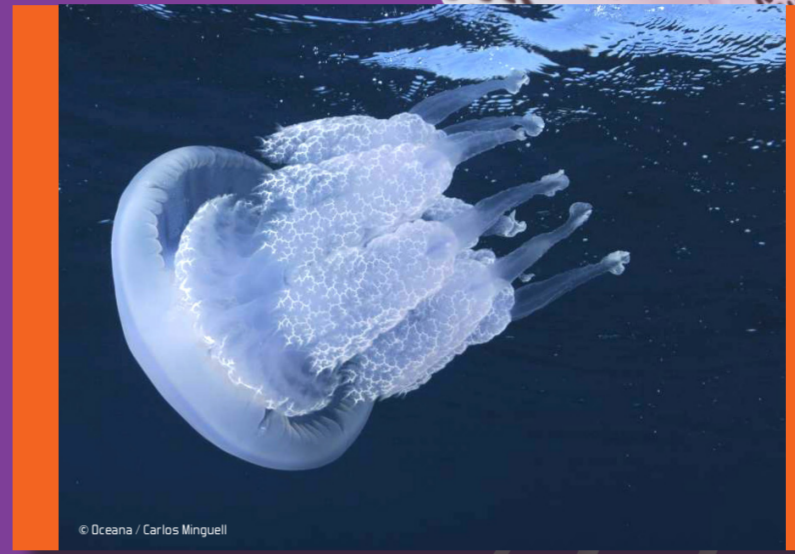
Aguamala o acalefo azul Rhizostoma pulmo Peligrosidad: ALTA