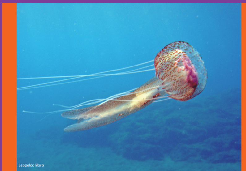
Pelagia o aguaviva Pelagia noctiluca Peligrosidad: ALTA