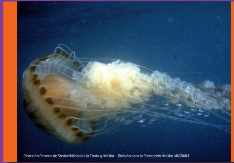
Medusa de compases Chrysaora hysoscella Peligrosidad: ALTA