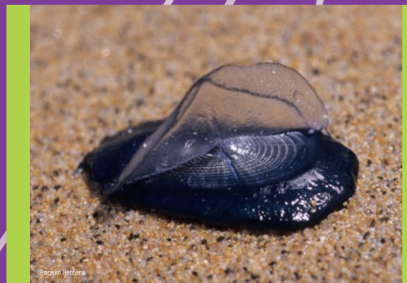
Velero Velella velella Peligrosidad: BAJA