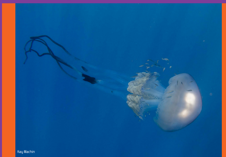
Rhizostoma luteum Rhizostoma luteum Peligrosidad: ALTA