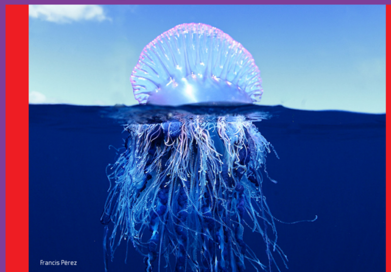
Carabela portuguesa Physalia physalis Peligrosidad: MUY ALTA