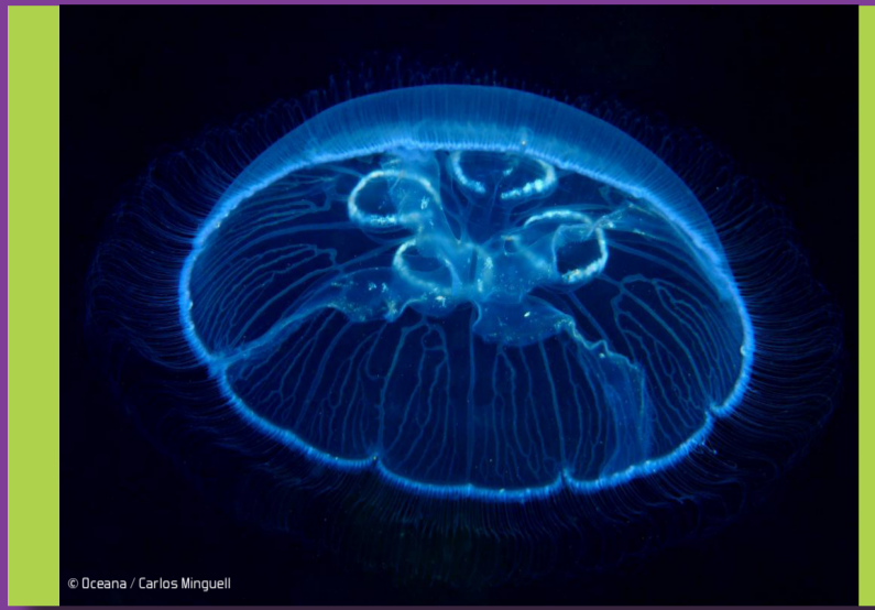
Medusa común o aurita Aurelia aurita Peligrosidad: BAJA